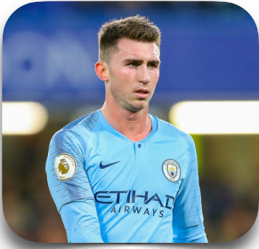
Aymeric LAPORTE MANCHESTER CITY