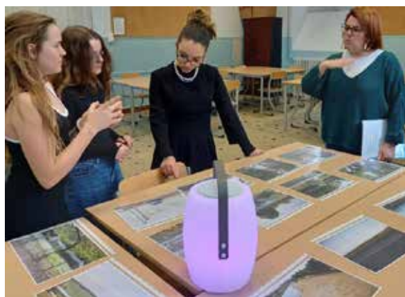
Projet photo "Touchées en plein coeur"